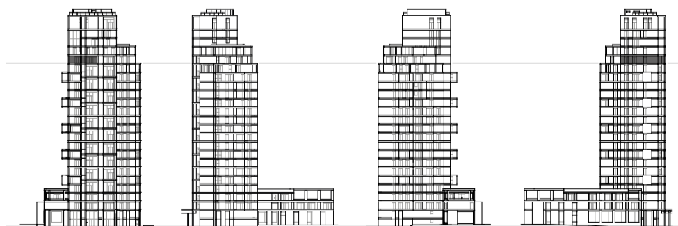
[ SE ] Via Stresa [ NE ] Giardino condominiale [ NO ] Via Belgirate [ SO ] Altre proprietà